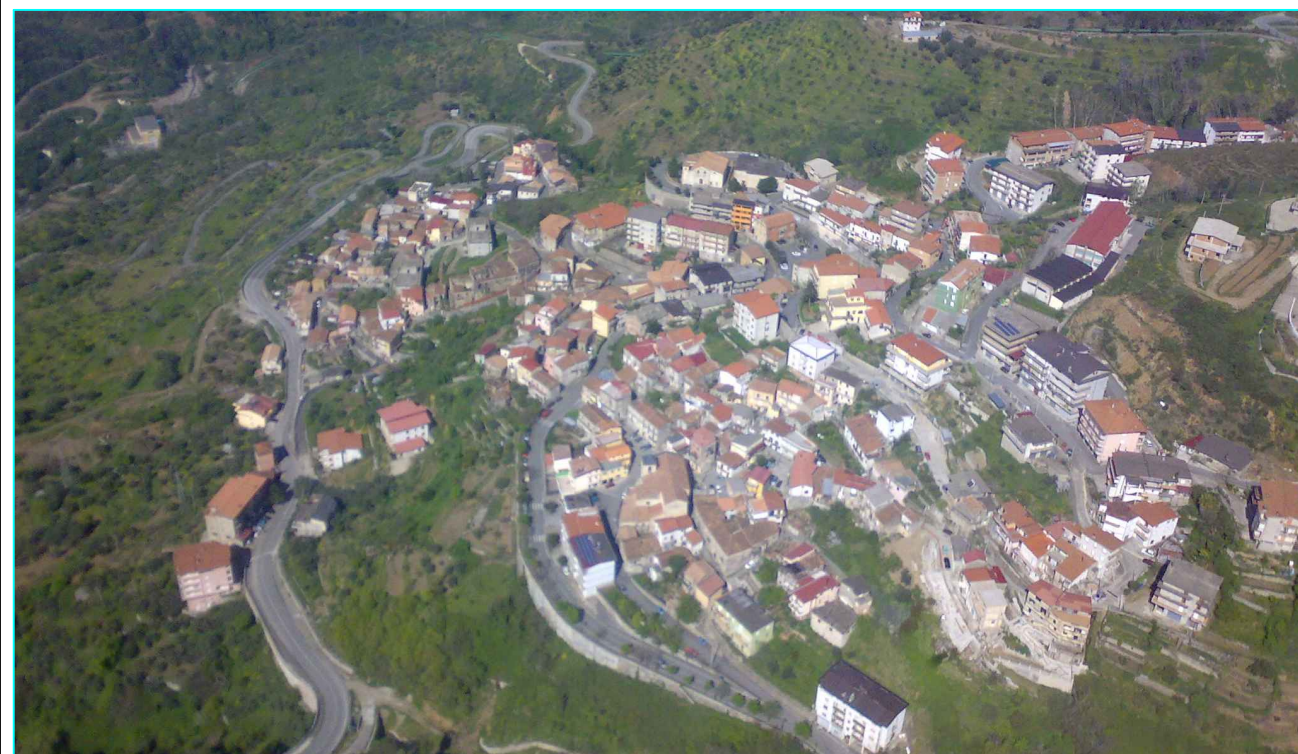
Tav. n° 05 - Carta dell'uso del suolo